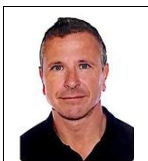
Eduard Vargas 618739736